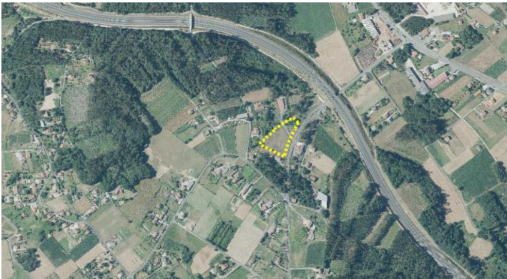
Ámbito de actuación

A autoestrada AP-53 atópase a uns 125 m ao noroeste do ámbito de actuación, e transcorre sobreelevada respecto á contorna, resultando o ámbito parcialmente visible desde esta. Esta estrada, pola súa IMD, non conta con mapas estratéxicos de ruído 1 .