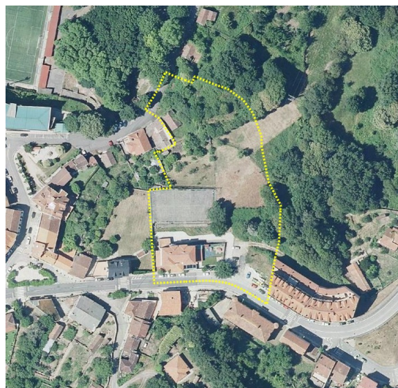
Emprazamento do plan especial

Superficie: 9.142,28 m 2 , segundo o levantamento topográfico realizado.